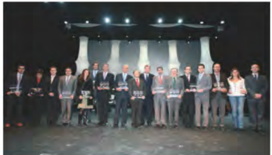
Imagen de todos los premiados con los galardones en la VIII Edición de los Premios Internet de Castilla y León

Como broche final de la entrega de los Premios Internet Castilla y León 2007, el Consejero de Fomento, Antonio Silván, hizo entrega del Premio de Honor a las Universidades Públicas de Castilla y León : Universidad de Valladolid ( www.uva.es ), Universidad de Salamanca ( www.usal.es ), Universidad de Burgos ( www.ubu.es ) y Universidad de León ( www.unileon.es ). Entre sus prioridades se encuentran el establecer siempre bajo un enclave digital cualquier servicio o recurso tecnológico, para que todos los usuarios puedan implementar las nuevas tecnologías en los distintos ámbitos de actuación y áreas docentes, dándole especial auge a las bibliotecas universitarias y campus virtuales en Castilla y León y profundizando en la necesidad de introducir las Nuevas Tecnologías en su metodología de trabajo.